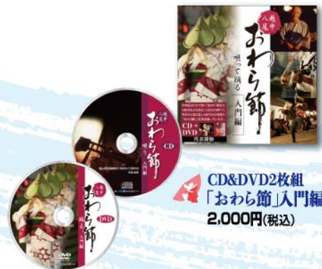
CD&DVD2枚組 「おわら節」入門編 2,000円(税込)