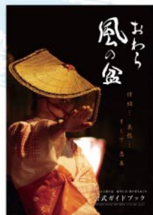
公式ガイドブック 「おわら風の盆」 1,500円(税込)